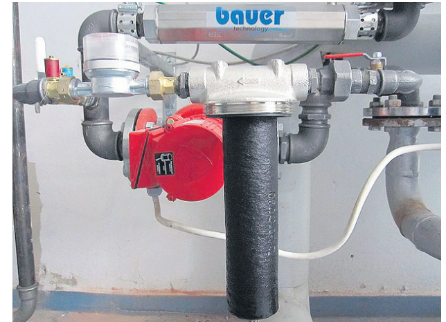
Uuden ja käytetyn suodatinpatruunan väri kertoo Bauer-laitteiston tehosta.

Bauerin laitteet ainakin niissä kohteissa, joissa on huoneistokohtainen vedenkulutuksen mittausta. Tällä hetkellä laitteita on kymmenessä kiinteistössä.